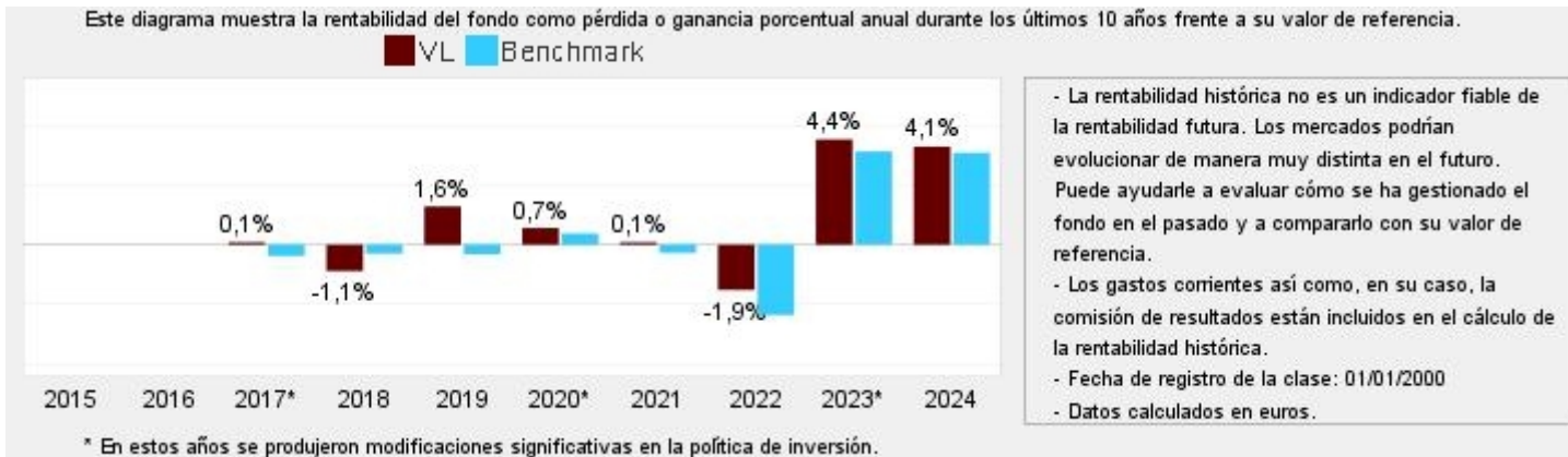
Gráfico rentabilidad histórica

Datos actualizados según el último informe anual disponible.